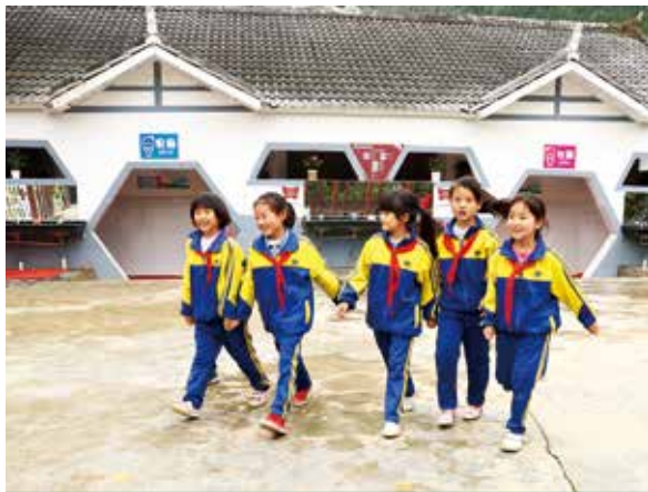
用上新厕所让女孩子们感到很开心。

我们与教育部合作开展的“学校水、环境卫生与个人卫生项目”,为贵州、云南、重庆、新疆和广西的300所乡村学校,送去了这样的礼物,帮助约15万名儿童用上卫生厕所和洗手设施,培养良好的卫生习惯。