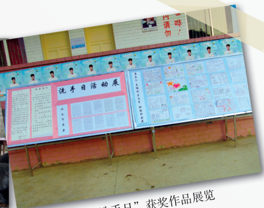
“全球洗手日”获奖作品展览