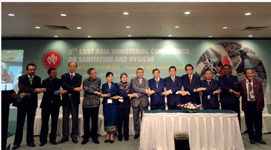
手拉手，共同走向2015及未来

目前，国际社会正在考虑如何在2015年之前进行最后的冲刺，使千年发展目标得以实现；同时考虑2015年之后的路如何走下去。东亚地区也在思考如何在未来目标的确定和加速投资及改善服务质量的设计上有所贡献。在此背景之下，第三届东亚环境卫生部长级会议于2012年9月10日至12日在印度尼西亚巴厘岛召开。本次会议的主题是“全民健康——走向2015及未来”，共有来自中国在内的14个国家以及世界卫生组织、联合国儿童基金会、世界银行等国际组织和机构的250多名代表参加。