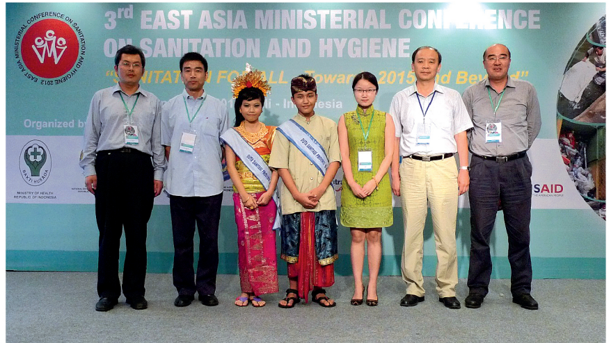
中国代表团成员与印尼巴厘岛省环境卫生形象大使合影

会上，中国代表团成员介绍了中国农村改厕工作进展与取得的成就；从政策、资金、技术、市场机制、农村环境监测、国际合作等方面分析了中国在农村改厕方面的具体做法和经验，强调了通过中央项目的示范带动作用，带动了农村的改厕，近年来中国农村卫生厕所普及率得到了快速增长。