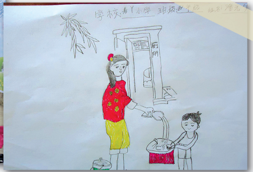
小学生关于洗手的绘画作品