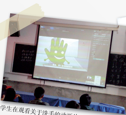
学生在观看关于洗手的动画片