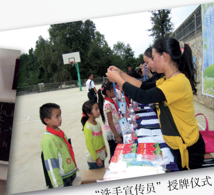
“洗手宣传员”授牌仪式