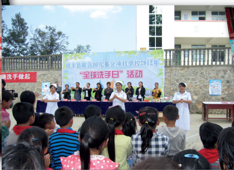
医护人员现场教授正确洗手方法