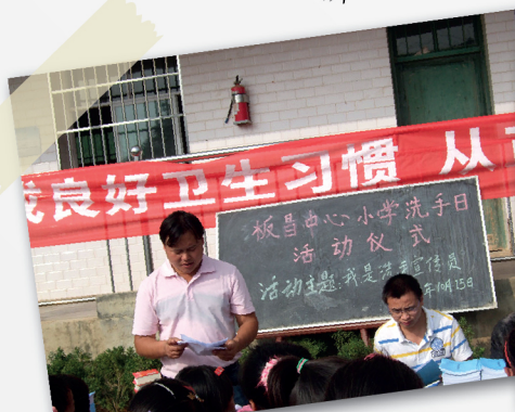
7 老师对洗手行为进行宣讲