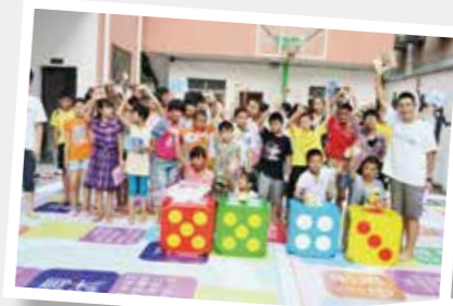
七夕七城防艾互动—安徽桐城现场

2014年7月我们在河南推出了促进青少年健康和参与的“爱益行”手机APP。青少年可以更方便地搜寻到包括防治艾滋病和生殖健康在内的资讯，主动寻求HIV检测和咨询，分享信息帮助同伴。河南省目前已经有5500名青少年注册使用，注册青少年组织和公益机构13家。通过爱益行寻求咨询或检测的脆弱易感青少年达到40人。