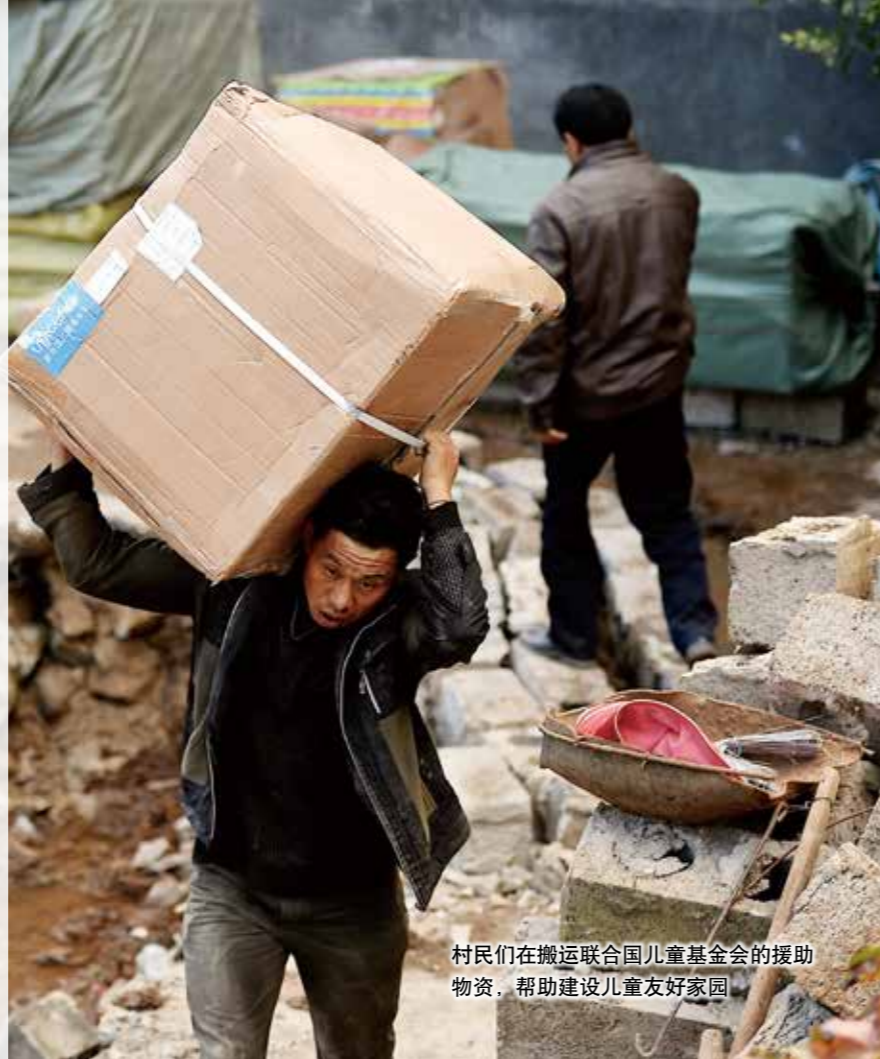
村民们在搬运联合国儿童基金会的援助物资，帮助建设儿童友好家园

2014年8月3日，云南省鲁甸县发生6.5级地震后，县乡级医疗机构房屋结构或设备受到损坏，当地县乡级医疗服务的提供也受到影响。联合国儿童基金会在云南省开展工作已经很长时间，特别是在本次受地震影响的两个县（鲁甸和昭阳），我们开展母子健康和儿童友好家园项目，现在绝大部分工作都受到地震影响。因此我们立即启动了应急响应机制，帮助当地恢复妇幼保健服务。我们为重灾区的市县乡级妇幼卫生保健院提供了大批亟需的孕产妇和新生儿医疗设备。这些儿科急救设备至今仍在守护当地30多万育龄妇女和11万五岁以下儿童的生命。