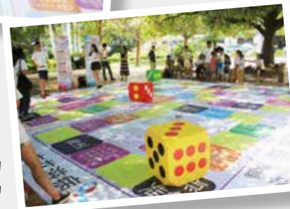
七夕七城防艾互动—福建泉州现场

2014年8月，我们联合七个城市的青少年爱心大使做了“七夕七城特别约会”，在青少年集中的闹市区，一起玩转融入了“防艾知识”的飞行棋。“约会”当天，北京、郑州、桐城、泉州、长春、深圳、广州共有5000余名青少年及志愿者参加了真人棋盘游戏，了解艾滋病和生殖健康知识。仅在北京就有26家媒体40名记者不仅参与活动报导，而且以志愿者身份与青少年一起体验现场互动。在新浪微博上发起的“七夕七城特别约会”微活动，也达到了110万阅读量。