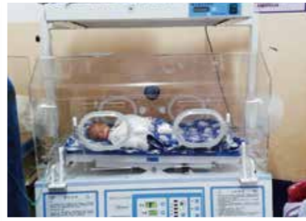
鲁甸县妇幼保健院的新生儿暖箱已投入使用