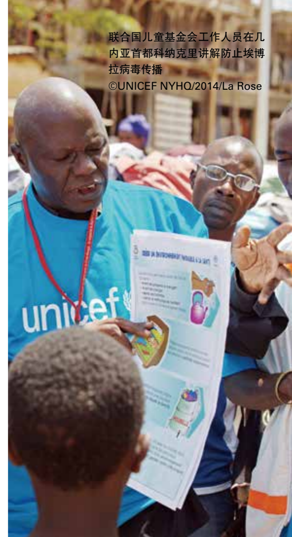
联合国儿童基金会工作人员在几内亚首都科纳克里讲解防止埃博拉病毒传播

利比里亚的新增感染病例得到了控制，也让我们看到了希望，通过卫生习惯的改变和扎根社区的干预措施，是可以击退病毒的。我们亟需全面加强防线和援助力度，但是所需资金仍然存在巨大缺口，我们需要您的帮助继续开展援助。