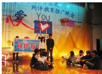
同伴教育推广晚会·南京

MSIC通过将生殖健康与艾滋病结合的方式来综合的对大学生进行宣传。在大学中开展以生殖健康及艾滋病预防为主题的2小时结构式同伴教育为基本活动兼有形式多样的其它活动，通过多种宣传方式全方面创造生殖健康和预防艾滋病的氛围，提高大学生生殖健康水平。