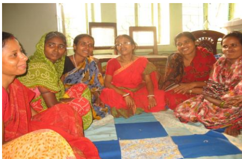
父母小组中的分享活动

关键指标包括 a) 沟通技能， b) 领导力， c) 照料家长的能力。数据显示，儿童各指标的情况都有所改善，说明孩子的韧性有所增加。25.8%的儿童沟通技能有所改善，29%领导力得到改善，35%照料家长的能力有所提高。此外，评估还发现，孩子与父母间开放的沟通、对共同的回忆的分享、责任的承担、自我表达和参与家庭决策能力的提高以及支持性的环境都有助于孩子适应艾滋病带来的家庭变故。