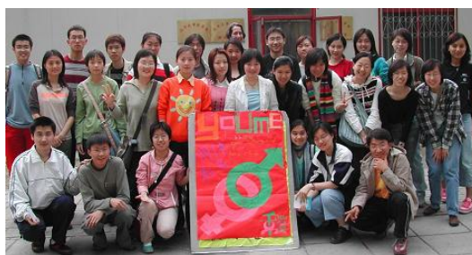
大学生志愿者走进中学