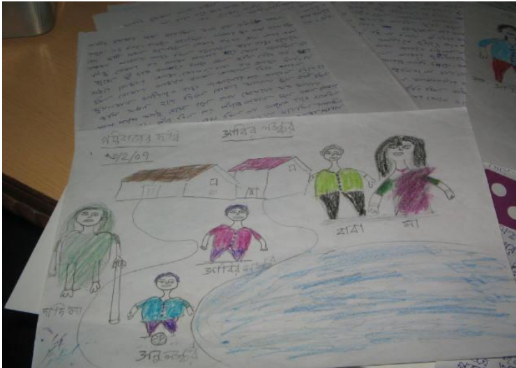
一个孩子的回忆本