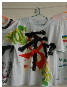
文化衫设计大赛·青岛