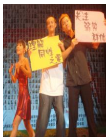
预防艾滋病晚会·南宁