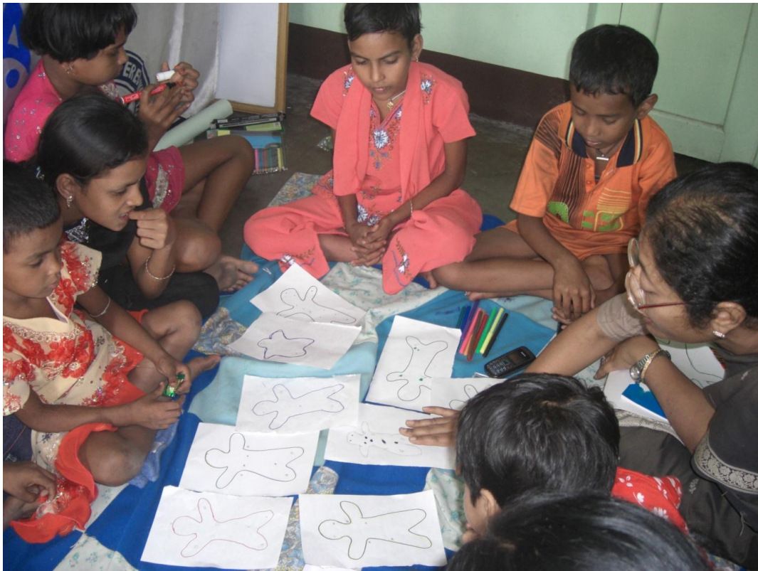
关于善意与恶意身体接触的小组学习

儿童学习小组分为5—10岁组和10—18岁组。年幼儿童课程多数通过趣味学习开展，如游戏、诗、舞蹈和音乐等，主要目的在于帮助孩子沟通并密切其人际关系。通过学习，孩子们了解了人体是如何运转的、有哪些主要器官（包括性器官）、人为什么会生病等，这些都是在为讲解艾滋病问题做准备，有助于向孩子解释艾滋病病毒如何破坏人体免疫系统。这些内容也有助于孩子们开展关于善意和恶意身体接触的讨论，帮助他们理解何时以及如何保护自己免受他人侵犯。