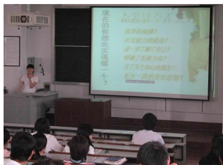
艾滋病知识宣传讲座·西安