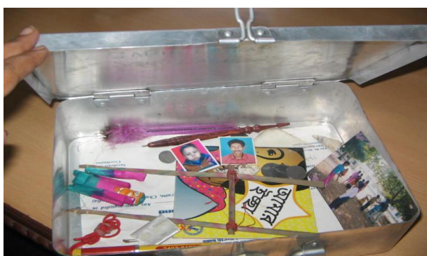
一个孩子装满宝贝的回忆盒